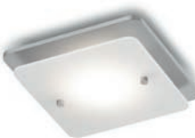
PIA-1 91.351.05 mattnickel 1 x 10 W LED, 980 lm, 2.700 K, Ra > 90 Energieeffizienzklasse A+ zentral dimmbar über Phasenabschrittdimmer flacher Aufbau durch Magnethalterung