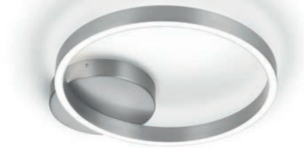
ANEL-40 91.345.05 mattnickel 1 x 33 W LED, 2.700 K, 3.960 lm, Ra > 90 Energieeffizienzklasse A+ zentral dimmbar über Phasenabschrittdimmer direkte / indirekte Beleuchtung