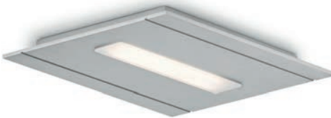
SINA-1 91.350.05 mattnickel 1 x 13,6 W LED, 1.750 lm, 2.200 - 2.900 K, Ra > 90 Energieeffizienzklasse A+ flacher Aufbau durch Magnethalterung zentral dimmbar über Universal Triac LED Dimmer 2-100 W mit dim to warm Technologie