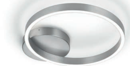
ANEL-40 91.345.05 mattnickel 1 x 33 W LED, 2.700 K, 3.960 lm, Ra > 90 Energieeffizienzklasse A+ zentral dimmbar über Phasenabschrittdimmer direkte / indirekte Beleuchtung