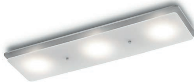
PIA-3 91.348.05 mattnickel 3 x 10 W LED, 2.940 lm, 2.700 K, Ra > 90 Energieeffizienzklasse A+ zentral dimmbar über Phasenabschrittdimmer flacher Aufbau durch Magnethalterung