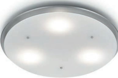
PIA-R3 91.352.05 mattnickel 3 x 10 W LED, 2.940 lm, 2.700 K, Ra > 90 Energieeffizienzklasse A+ zentral dimmbar über Phasenabschrittdimmer flacher Aufbau durch Magnethalterung