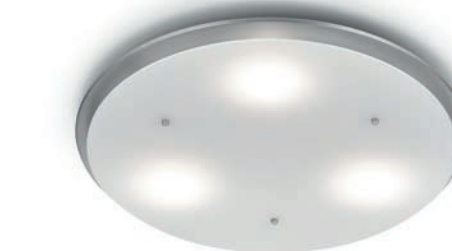
PIA-R3 91.352.05 mattnickel 3 x 10 W LED, 2.940 lm, 2.700 K, Ra > 90 Energieeffizienzklasse A+ zentral dimmbar über Phasenabschrittdimmer flacher Aufbau durch Magnethalterung