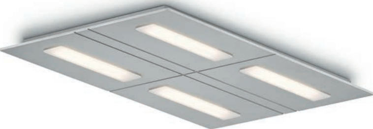
SINA-4 91.355.05 mattnickel 4 x 13,6 W LED, 7.000 lm, 2.200 - 2.900 K, Ra > 90 Energieeffizienzklasse A+ flacher Aufbau durch Magnethalterung zentral dimmbar über Universal Triac LED Dimmer 2-100 W mit dim to warm Technologie