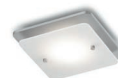
PIA-4 91.349.05 mattnickel 4 x 10 W LED, 3.920 lm, 2.700 K, Ra > 90 Energieeffizienzklasse A+ zentral dimmbar über Phasenabschrittdimmer flacher Aufbau durch Magnethalterung