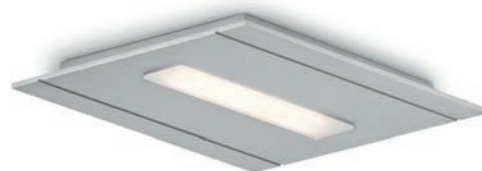
SINA-2 91.353.05 mattnickel 2 x 13,6 W LED, 3.500 lm, 2.200 - 2.900 K, Ra > 90 Energieeffizienzklasse A+ flacher Aufbau durch Magnethalterung zentral dimmbar über Universal Triac LED Dimmer 2-100 W mit dim to warm Technologie