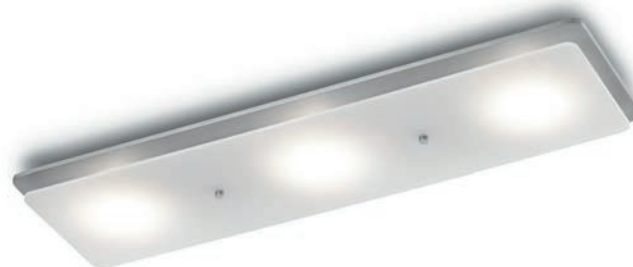
PIA-3 91.348.05 mattnickel 3 x 10 W LED, 2.940 lm, 2.700 K, Ra > 90 Energieeffizienzklasse A+ zentral dimmbar über Phasenabschrittdimmer flacher Aufbau durch Magnethalterung