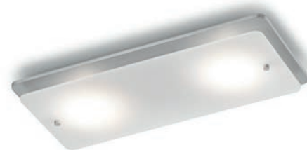
PIA-2 91.347.05 mattnickel 2 x 10 W LED, 1.960 lm, 2.700 K, Ra > 90 Energieeffizienzklasse A+ zentral dimmbar über Phasenabschrittdimmer flacher Aufbau durch Magnethalterung