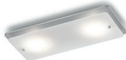
PIA-2 91.347.05 mattnickel 2 x 10 W LED, 1.960 lm, 2.700 K, Ra > 90 Energieeffizienzklasse A+ zentral dimmbar über Phasenabschrittdimmer flacher Aufbau durch Magnethalterung