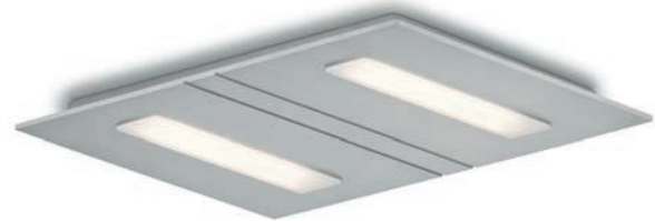
SINA-2 91.353.05 mattnickel 2 x 13,6 W LED, 3.500 lm, 2.200 - 2.900 K, Ra > 90 Energieeffizienzklasse A+ flacher Aufbau durch Magnethalterung zentral dimmbar über Universal Triac LED Dimmer 2-100 W mit dim to warm Technologie