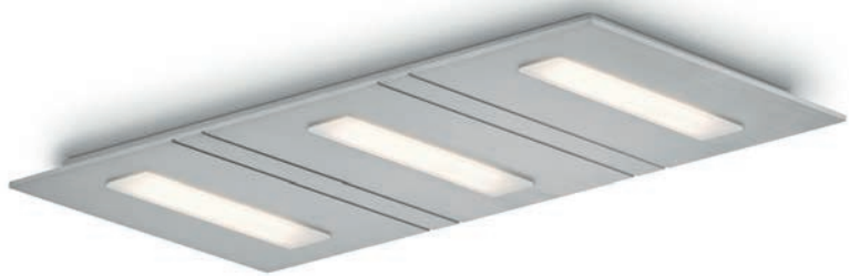
SINA-3 91.354.05 mattnickel 3 x 13,6 W LED, 5.250 lm, 2.200 - 2.900 K, Ra > 90 Energieeffizienzklasse A+ flacher Aufbau durch Magnethalterung zentral dimmbar über Universal Triac LED Dimmer 2-100 W mit dim to warm Technologie