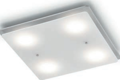
PIA-4 91.349.05 mattnickel 4 x 10 W LED, 3.920 lm, 2.700 K, Ra > 90 Energieeffizienzklasse A+ zentral dimmbar über Phasenabschrittdimmer flacher Aufbau durch Magnethalterung